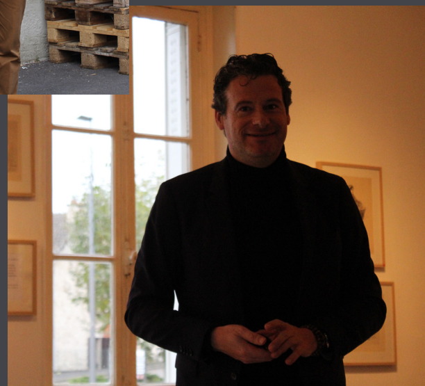
Lancement de saison 2019

La Maison du Tourisme est également la maison des habitants du territoire.