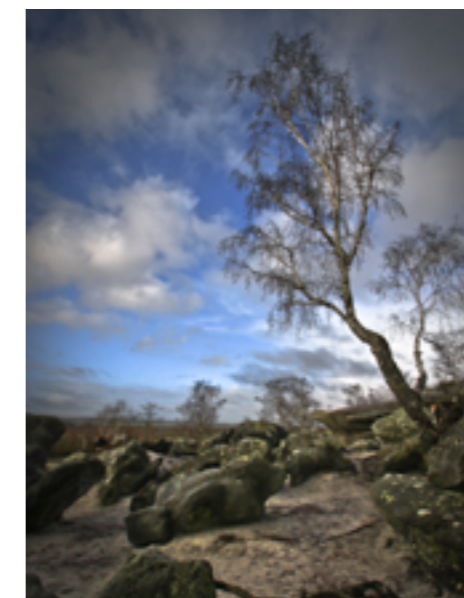
La Hottée du Diable

Savez-vous qu'en suivant cet aqueduc de bout en bout vous pouvez arriver jusqu'à Paris ?