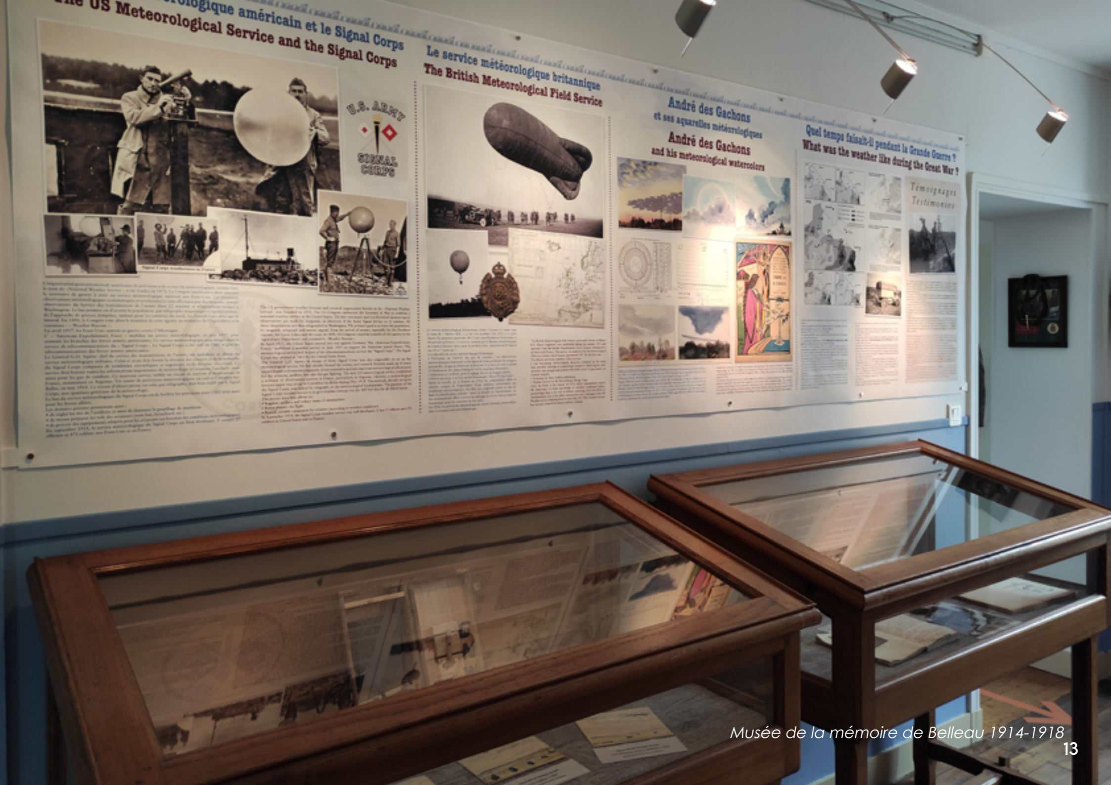
Musée de la mémoire de Belleau 1914-1918