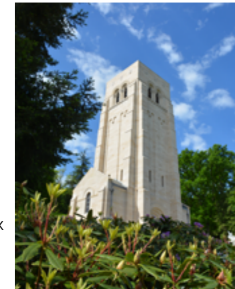
Cimetière Aisne-Marne - Belleau

Ses vitraux racontent l'histoire du protestantisme et de l'entrée en guerre des Américains à Château-Thierry.