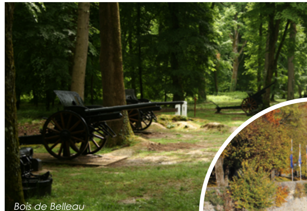
Bois de Belleau

L'abus d'alcool est dangereux pour la santé, à consommer avec modération.