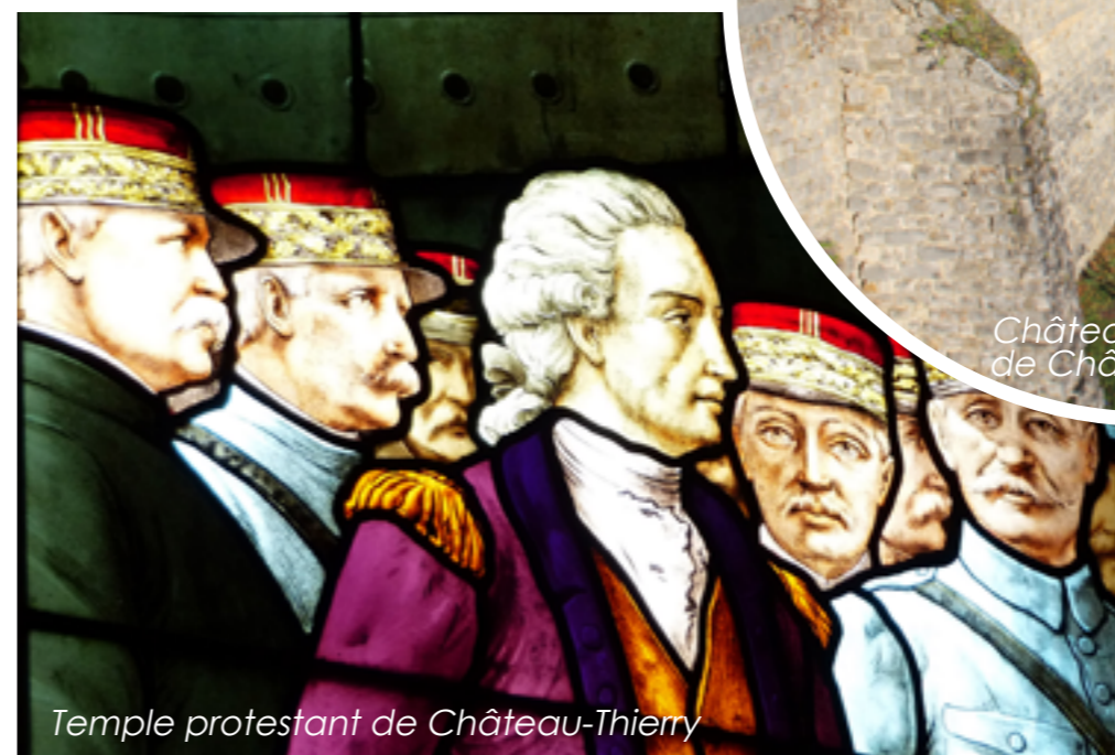
Temple protestant de Château-Thierry