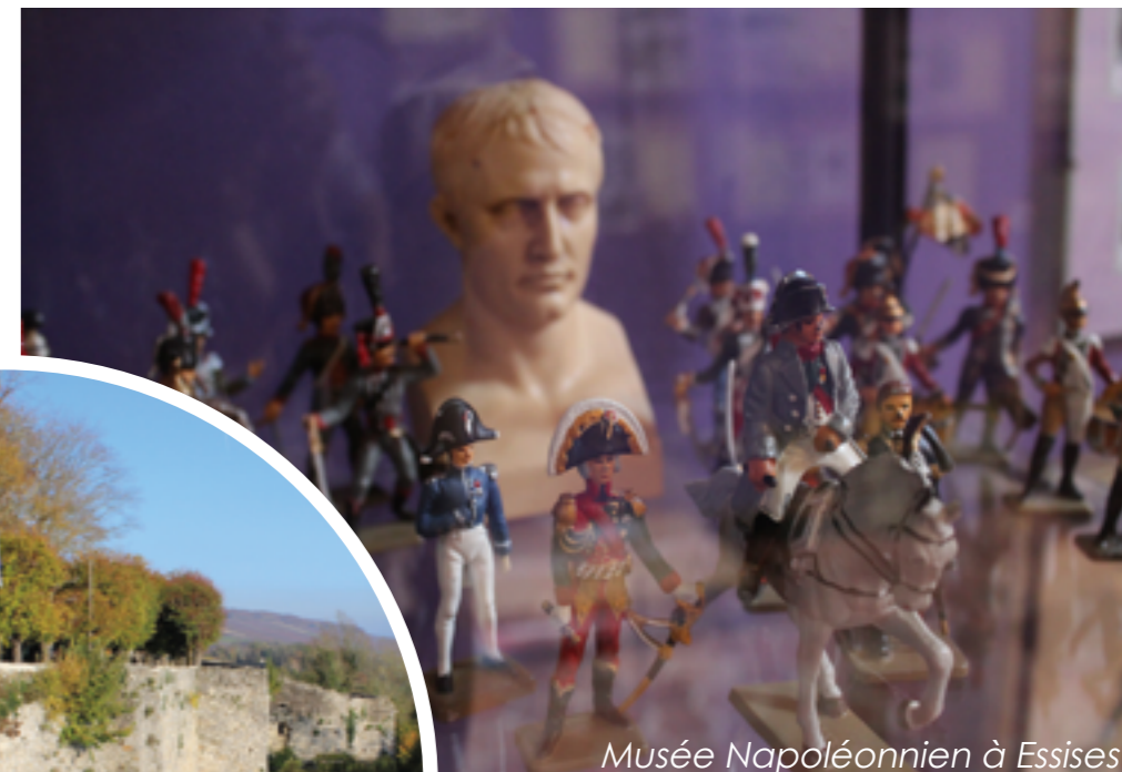
Musée Napoléonien à Essises