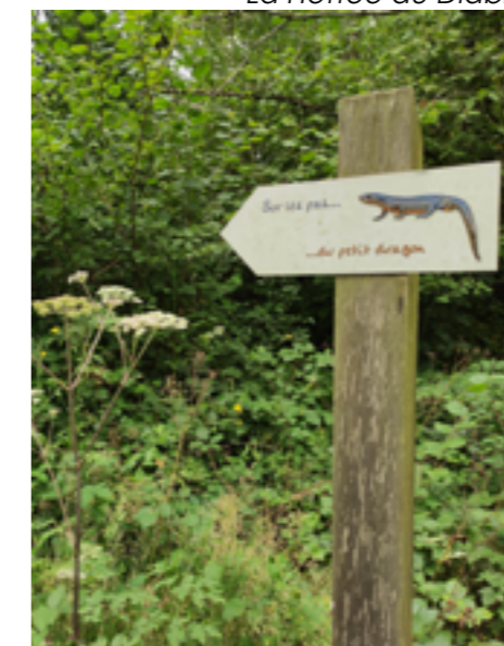
Etang de la Boutache