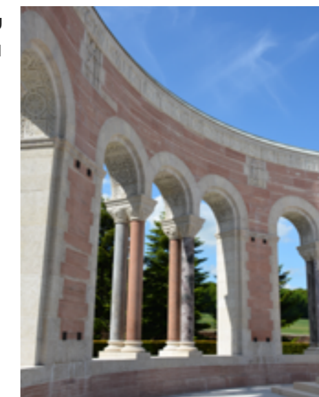
Cimetière Oise-Aisne - Seringes-et-Nesles