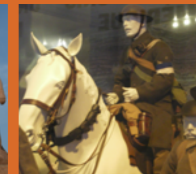
Musée Grande Guerre du Pays de Meaux