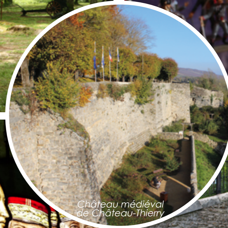
Château médiéval de Château-Thierry