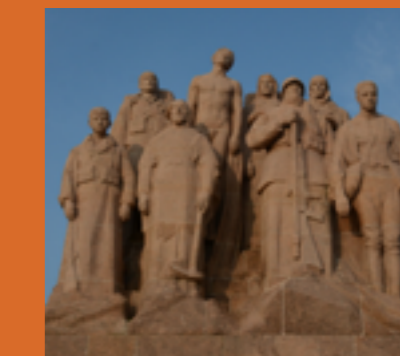
Les fantômes de Landowski